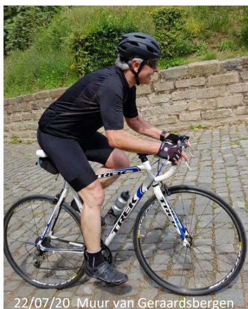
22/07/20 Muur van Geraardsbergen

Is het droog en het vriest niet te hard kan er gereden worden, warm aankleden en we zijn weg. Of wat off road tochtjes met aangepaste fietsen behoren ook tot de mogelijkheden. Sommigen zullen even de fiets aan de haak hangen en de loopschoenen terug aantrekken, ieder zijn meug. Vanaf maart/april volgend jaar gaan we weer het zomerseizoen in.