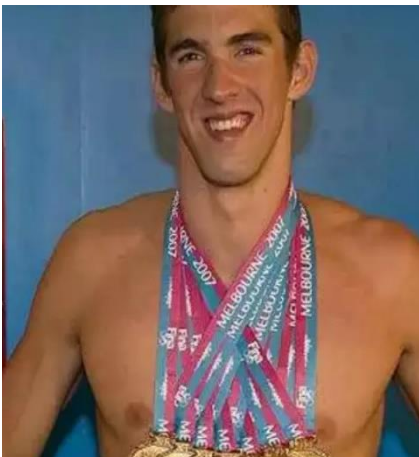
Michael Phelps, overladen met medailles!!