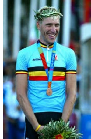
Justine Henin pronkt met goud! Ilse Heylen met brons. Axel Merckx, brons