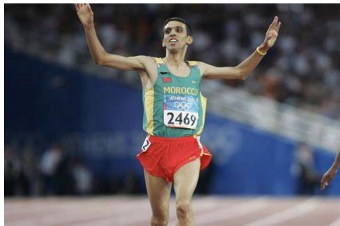
Hicham El Guerrouj wint goud op de 5000m