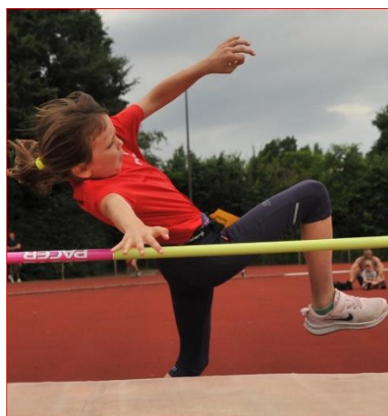
Lux overschrijdt de lat!