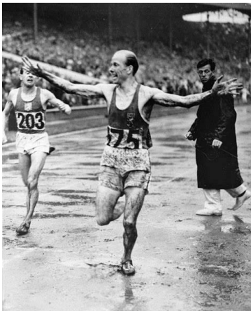
Gaston Reiff verslaat Emiel Zatopek met 0.2 seconden.