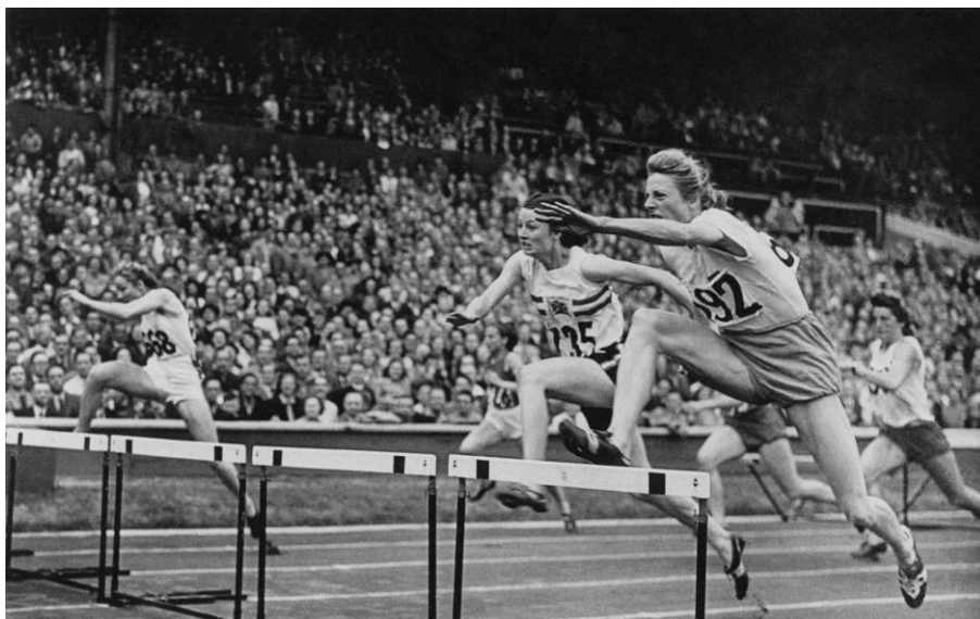
Een prachtige actiefoto: 'Flying housewife' Fanny Blankers Koen snelt naar de zege op de 80 horden!